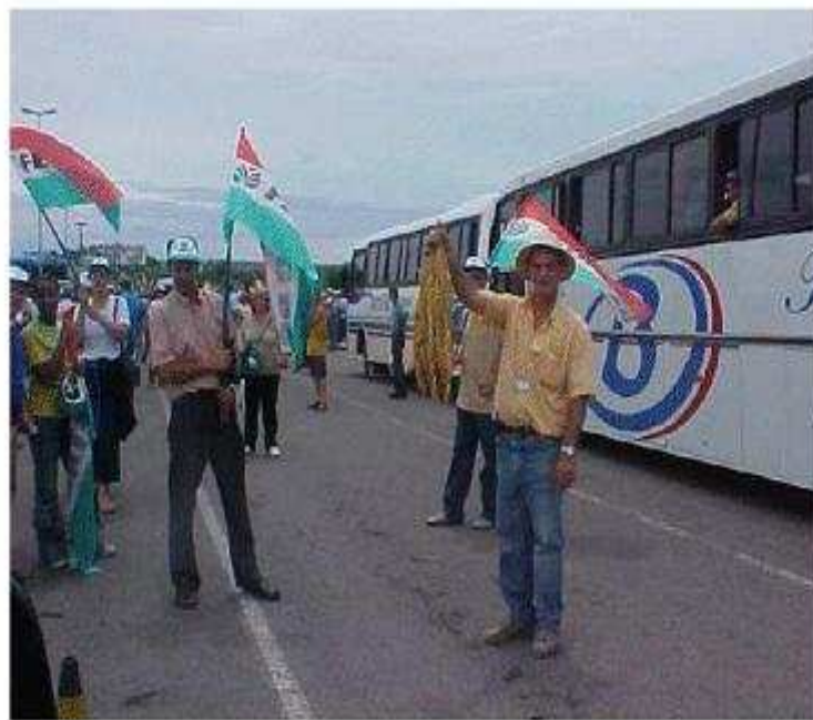
Santa Cruz do Sul – RS