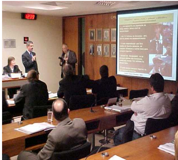
Audiência Brasília (DF)