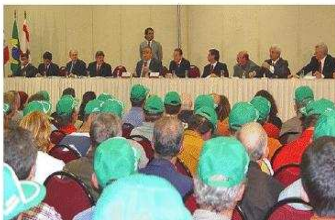
Florianópolis - SC